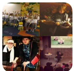
De fire vinnerne fra fjorårets fotokonkurranse med temaet Fremtiden i Norden